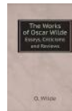
The Works of Oscar Wilde 1905.