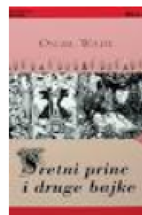
Sretni princ i druge ba... 1888.