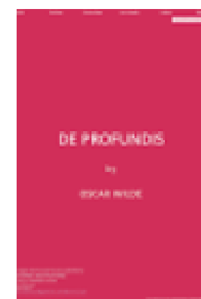
De profundis 1905.